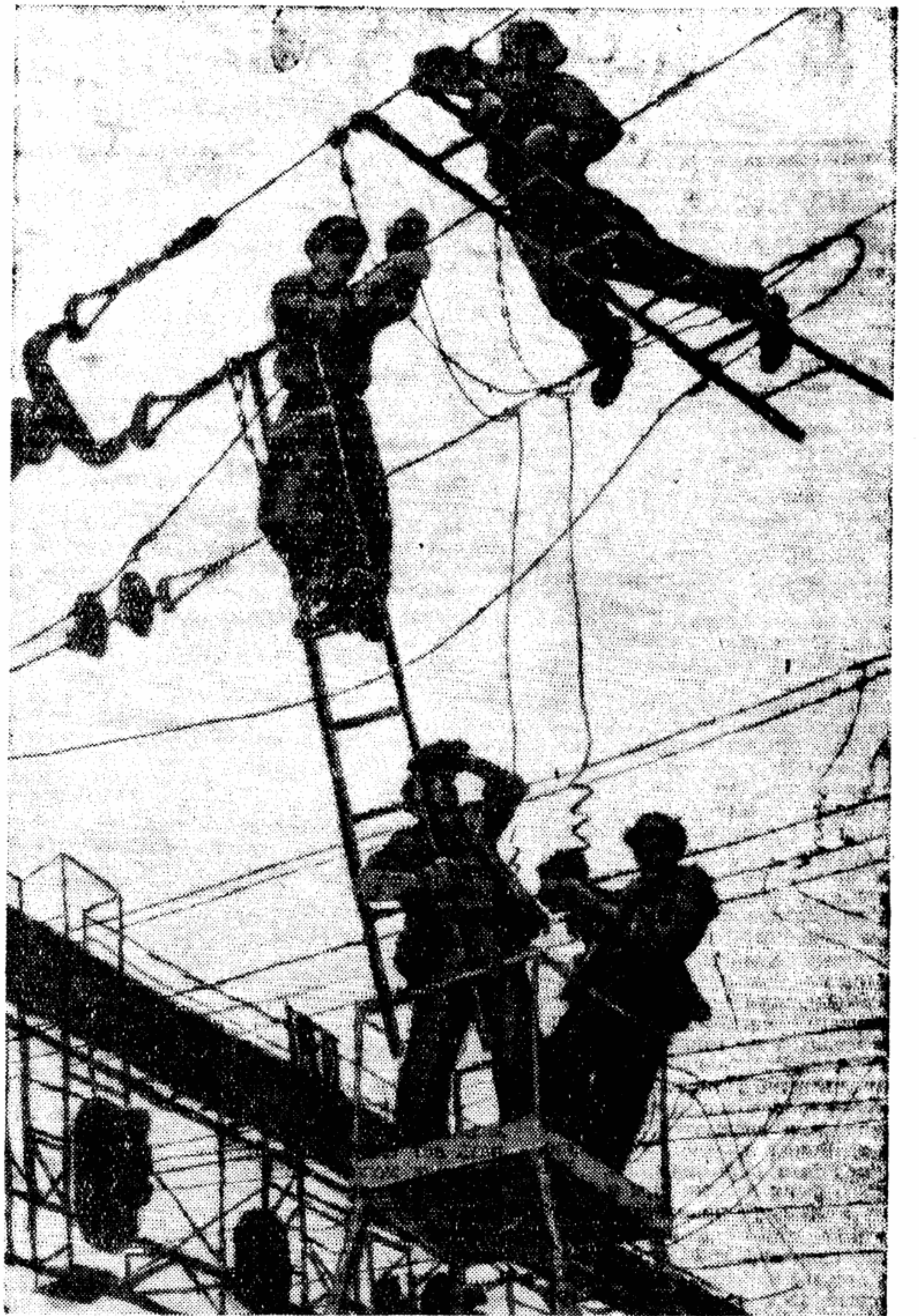
Цветная линогравюра В. Полнова «Трудовые будни». Весоюзная художественная выставка «40 лет ВЛКСМ».

Толмачева Н. Старшая сестра. Повесть. Свердловское книжное издательство. 279 стр. 75 000 экз. 6 руб.