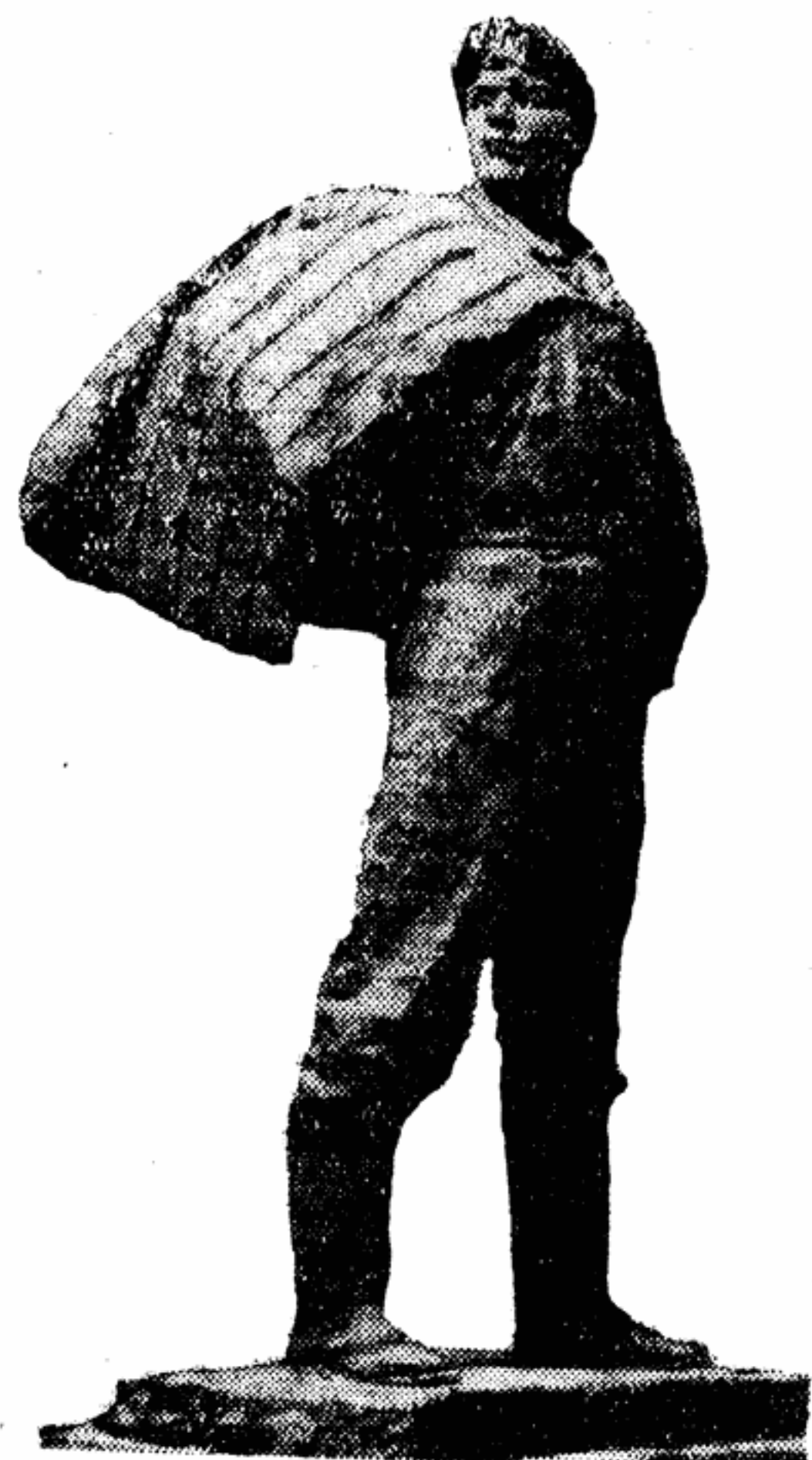
Скульптура М. Сковородина «Хозяин при- данных полей». Весоюзная художественная выставка «40 лет ВЛКСМ».